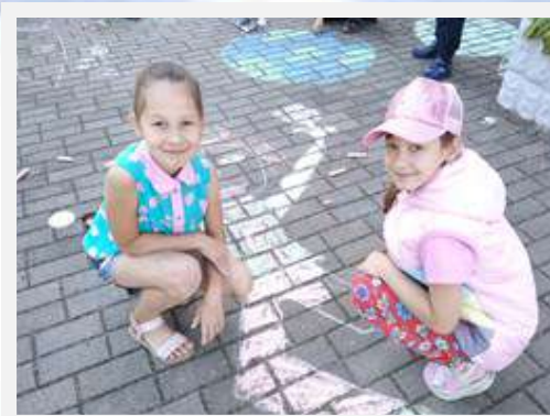
Конкурс рисунков на асфальте «Эти полезные овощи и фрукты» (2 «А» класс)