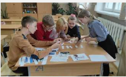
Квест-игра «Единство в нас» (7 «Б» класс)